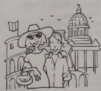
In the past...

2 Guarda le immagini. Scrivi delle frasi.